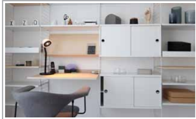
Bei Freiraum Einrichtungen finden Funktion, Qualität und Design zusammen.

Als Inneneinrichter- und Expertenteam sorgt Freiraum München auch regelmäßig in Neubau-Musterwohnungen für Behaglichkeit. Leere Räume wirken oft trist, kühl und kleiner als sie sind. Kaufinteressenten fehlt meist die Vorstellungskraft. Komplett eingerichtete Musterwohnungen sind die Lösung, denn sie zeigen, mit viel Fingerspitzengefühl und Liebe zum Detail gestaltet, wie Einrichtung und Beleuchtung die Zimmer zu einladenden Wohnbereichen machen. Zahlreiche Bauherren und Bauherren nutzen bereits diese Möglichkeit, um Wohnraum von seiner besten Seite zu präsentieren und potenziellen Käufern einen angenehmen, wohnlichen Eindruck zu vermitteln.