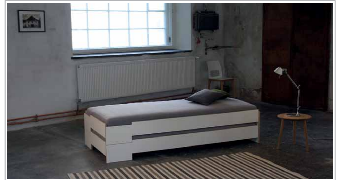
Das Stapelbett Bett 2 – perfekt aufeinander abgestimmt

Mit einer stimmigen Einrichtung präsentieren sich Musterwohnungen von Ihrer besten Seite.