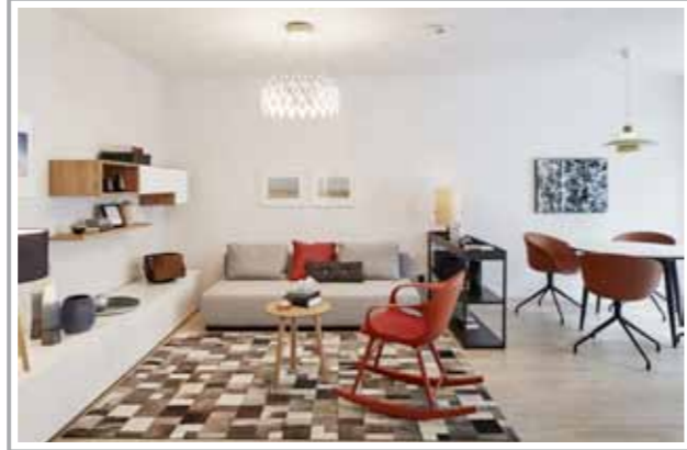
Mit Liebe zum Detail werden Musterwohnungen zu Wohnräumen.

Bei Freiraum können Kunden immer erwarten, dass die einzelnen Produkte präzise ausgewählt wurden, unter Berücksichtigung der Verarbeitungsqualität, der Handhabungsqualität und der formalen Qualität, die auch in 10 Jahren noch attraktiv ist. Nur Produkte, die wirklich und auf ganzer Linie überzeugen, werden ins Sortiment aufgenommen. Zum Service gehört die Beratung von Fachleuten, meist Innenarchitekten, die in ihrem täglichen Schaffen immer wieder ein Auge und ein Händchen dafür haben, wie mit einzelnen Gegenständen ein gelungener „Lebensraum“ wird, eine geschmackvolle Einrichtung, die lange gefällt, die zum Wohlfühlen einlädt. Ob Licht, Stauraum, Schlafen oder Arbeiten – Einrichtungswünsche und -herausforderungen werden bei Freiraum individuell umgesetzt.